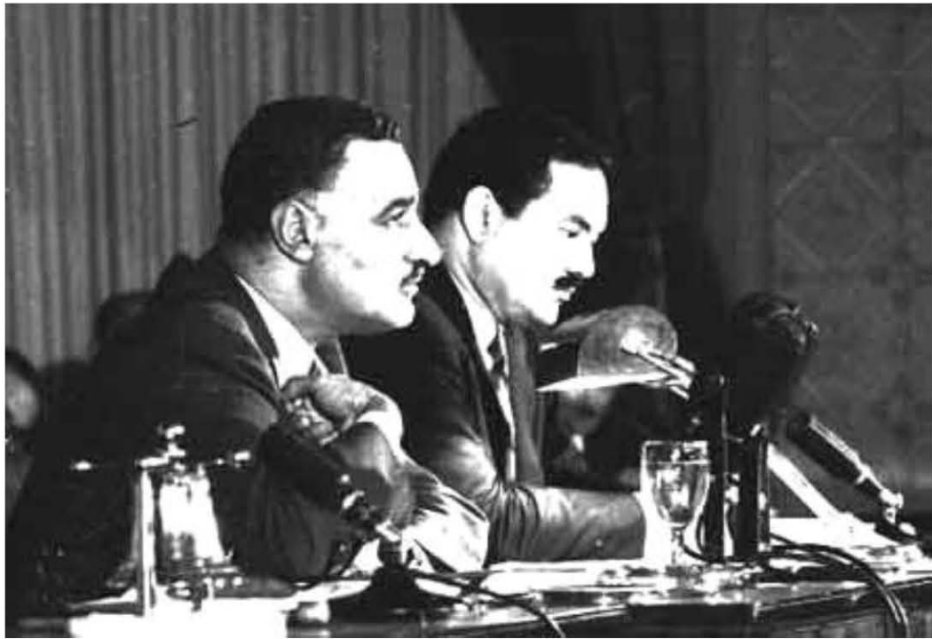
عبد الناصر أثناء مناقشة الميثاق ١٩٦٢/٧/٤